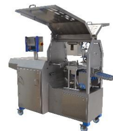
POSICIÓN DE LIMPIEZA