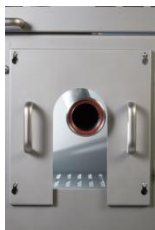
BOCA DE LLENADO DE PRODUCTO