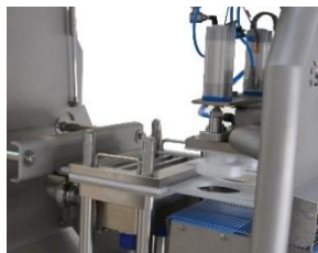
FORMADOR Y EXPULSIÓN