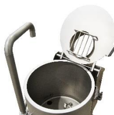
BOCA DE CARGA