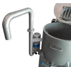
TUBO DE ALIMENTACIÓN LÍQUIDOS